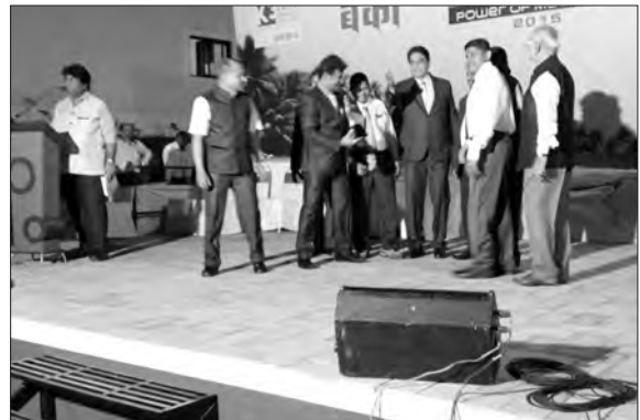
दिनांक २०.०१.२०१६ ते २२.०१.२०१६ रोजी बँको गोवा येथे झालेल्या सहकार प्रशिक्षणामध्ये उत्कृष्ट संस्था पुरस्कार मिळाल्याबद्दल आनंद व्यक्त करताना संस्थेचे संचालक सदस्य